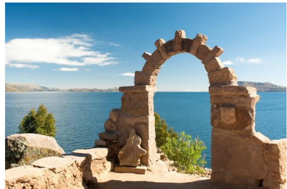
Tanquile Insel im Titicaca See